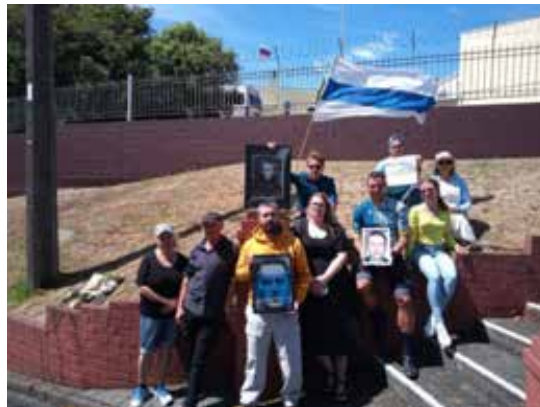
Веллингтон, акция у российского посольства, 17 февраля