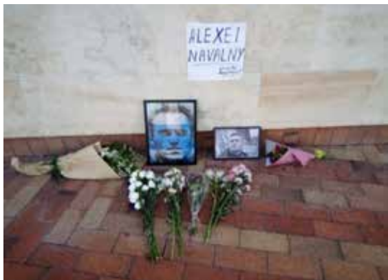
Civic Square, Веллингтон