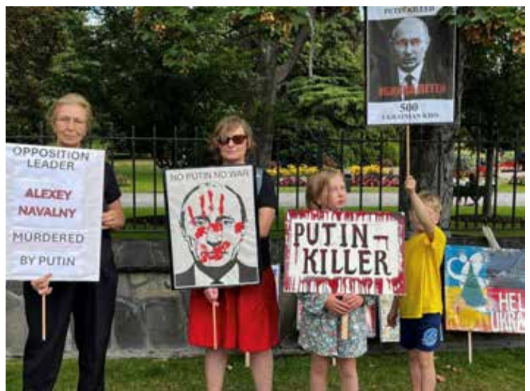
Акция в Крайстчерче, Новая Зеландия, 17 февраля