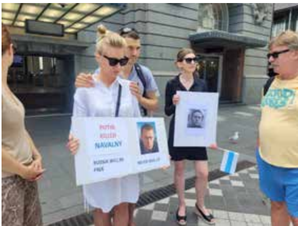
На митинге памяти Алексея Навального, Окленд, Новая Зеландия, 17 февраля

Абсолютное зло будет наказано. А героям – вечная слава.