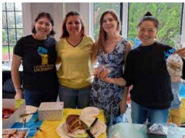
Активисты группы Russian-speaking Integrity Alliance (RSIA NZ).