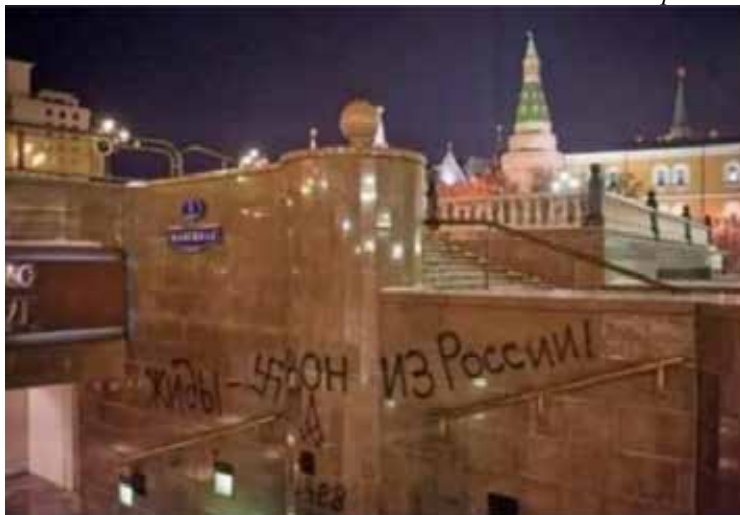
Центр Москвы, Манежная площадь, 1 Надпись — «Жи́ды вон из Росси́и!»

Не понимаю заложенной в такие "прогнозы" логики непротивления злу! Даже если тебя призвали, пригнали на фронт и дали оружие... зачем брать на себя грех и воевать, и убивать, и быть убитым? Если ты понимаешь бесчеловечную сущность этой Пу-войны, если ты против агрессии и кровавой бойни, развязанной рашистами, постарайся не быть бараном на заклание, постарайся сдать в плен и остаться в живых, не запятнав себя кровью - ни своей, ни чужой. Ищи такую возможность - в одиночку, или группой! Не дай "отцам"-командирам убить себя, им вообще на тебя наплевать! Это - лучшее, что ты можешь сделать для скорейшего завершения войны, для поражения безумной рашистской власти. Не