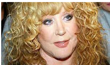
Алла Пугачева требует включить ее в список иностранных агентов