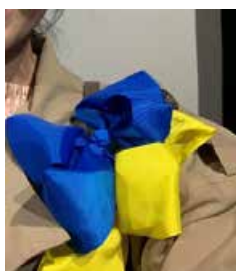
«Социологический эксперимент» на концерте "Good, better, best" объяснения в тексте

Во время концерта, точнее, в перерыве, к некоторым зрителям подходила женщина с ярким сине-желтым бантом, приколотым к одежде, и приветствовала их словами: