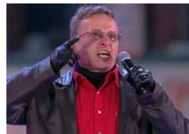
Актер Иван Охлобыстин на Красной площади 30.09 2022- провозглашает «священную войну»

Неожиданно для многих из нас - русских, живущих в Новой Зеландии, трагедия, разворачивающаяся там, вдруг стремительно приблизилась и ворвалась буквально в каждую семью: ведь почти у каж-