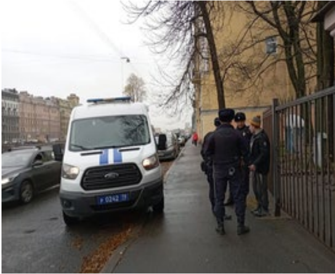
Принудительная мобилизация в Петербурге. «Задержали тщедушного парня в шапчонке. Втроем. Здоровые молодые лбы» - пишет Светлана Жаворонок, автор фото, жительница Петербурга. Фото она сделала утром 26-го октября по дороге на работу.

На стр. 9 этого номера мы публикуем типичную историю одного из «уклонистов» от мобилизации, бежавшего из Петербурга в Казахстан (Л. Никифорова, «Бег»)