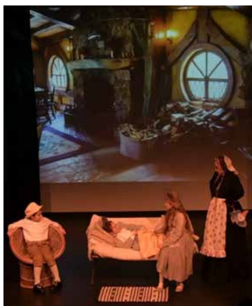
Инсценировка «Сказки о глупом мышонке»