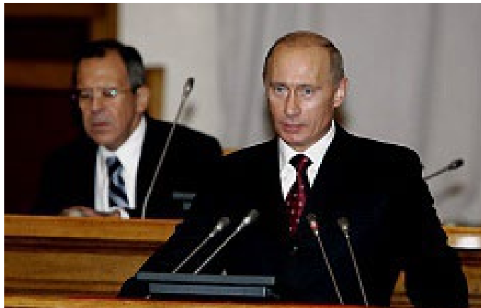
Выступление Владимира Путина на II Всемирном Конгрессе соотечественников (октябрь 2006-го года, Таврический дворец, Санкт-Петербург).

«Россия, Украина и Беларусь — это и есть Святая Русь!» - слова, предположительно принадлежащие священнослужителю Русской православной церкви, архимандриту Лаврентию Черниговскому, в качестве девиза неоднократно использовались на мероприятиях и собраниях, связанных с популяризацией концепции Русского мира.