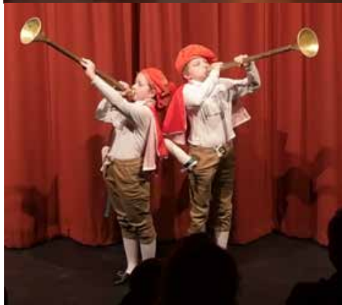
Фрагменты из спектакля «Двенадцать месяцев»