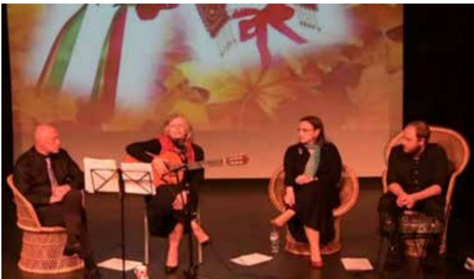
Заключительная часть вечера

На вечере собралась немногочисленная, но на редкость