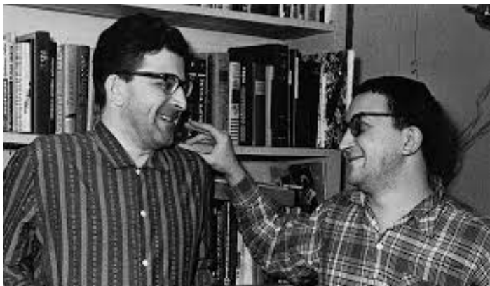
Аркадий и Борис Стругацкие, 1965