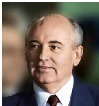
Михаил Горбачёв в 1989 году

Аркадий Стругацкий, Борис Стругацкий. «Обитаемый остров»