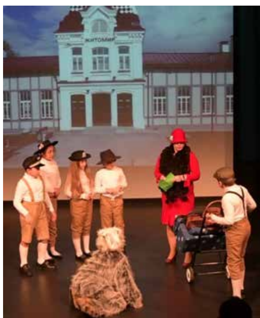
Инсценировка стихотворения «Багаж»

имеет реального прототипа? Иван Алексеевич Каблуков, известный ученый-химик, профессор Московского университета был, как многие профессора, очень рассеянным в повседневной жизни. О его рассеянности ходили легенды. Например, за столом он мог попросить кошечку чаю, а своим студентам сказать: «Следующая лекция будет не во вторник, а в пятницу! То есть, наоборот, в пятницу, а не во вторник». Прочитав стихотворение Маршака, Каблуков сразу узнал в Рассеянном себя, но на Маршака не обиделся. Инсценировка маршаковского «Багажа» доставила нашим юным участникам, пожалуй, наибольшее удовольствие, несмотря на то, что все элементы инсценировки надо было выверять с точностью до долей секунды, на что потребовалось много усилий и большое количество репетиций. Зато результатом мы остались довольны. Как, впрочем, и зрители.