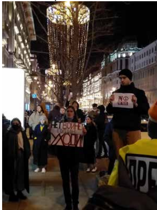
Протестующие в Москве на Тверской улице вечером 24 февраля 2022 года.

Россия либо покается и пойдёт мучительным, долгим путем перерождения, либо исчезнет с карты земного шара. Позор и презрение рашистским оккупантам! Пахану и его "шестеркам" - Страшный суд и вечное проклятие! Слава Украине!