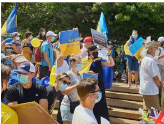
Антивоенный протест в Окленде, март