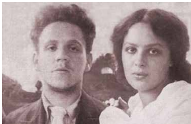
Самуил Маршак и Софья Мильвидская

Детские стихи Маршака легко запоминаются, они написаны прекрасным слогом и остроумны. Знаете ли вы, что герой знаменитого стихотворения про Рассеянного с улицы Бассейной – того, который надевал себе на голову вместо шляпы сковородку, а вместо носков пытался надеть перчатки –