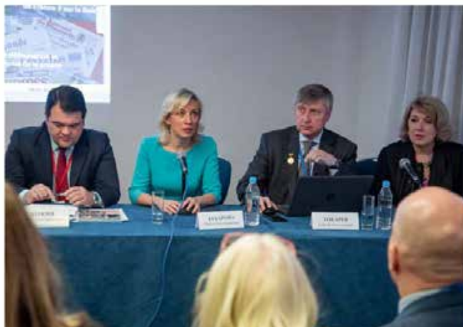
Выступление Марии Захаровой на секции «СМИ Русского зарубежья в современном мире» VI-ого Всемирного Конгресса соотечественников (Москва, 2018 год).

Стоит ли говорить о том, что подобная трактовка Русского мира и есть самое настоящее объявление войны всему остальному